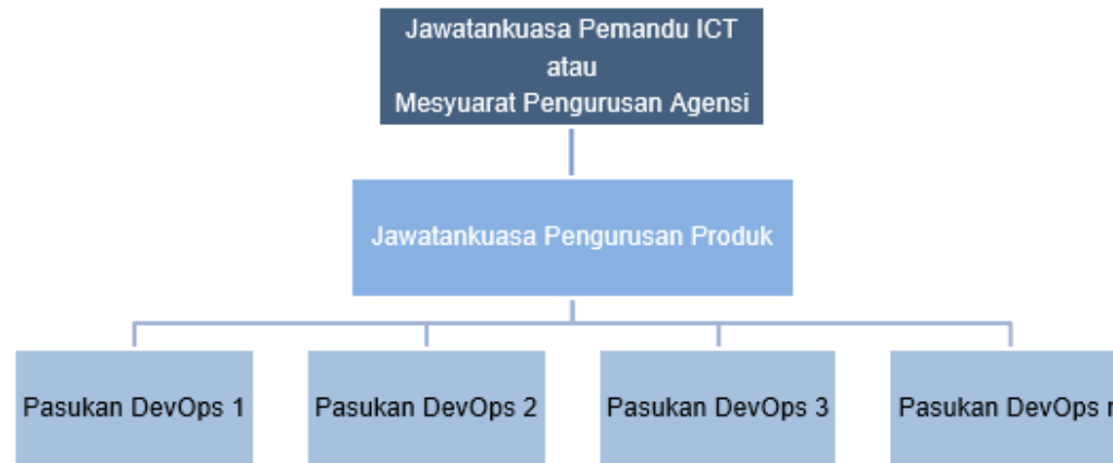
Rajah 4-12: Struktur Pelaporan dalam Pelaksanaan DevOps