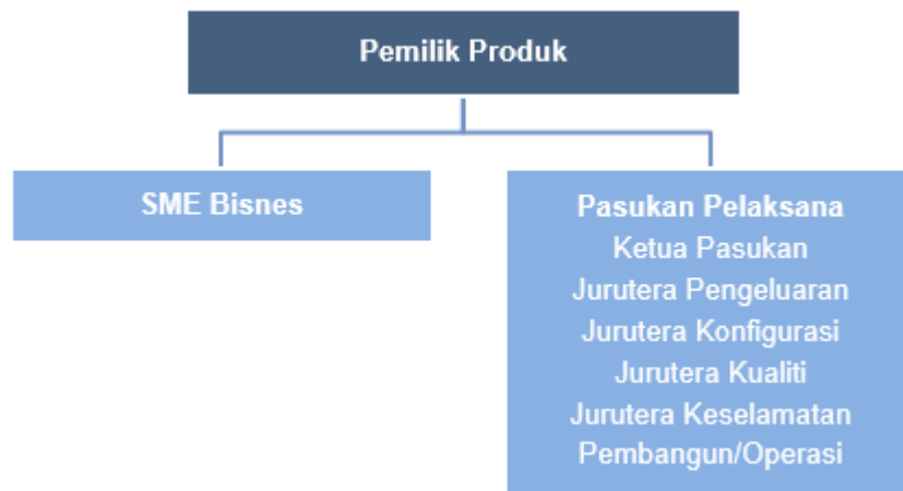
Rajah 4 16: Cadangan Keahlian Pasukan